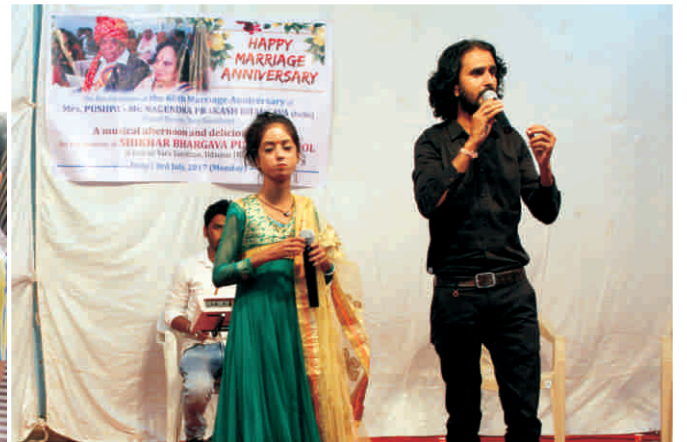
गीत संगीत भरी दोपहर