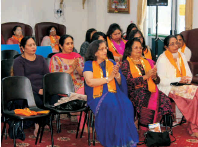
लेस्टर में उपस्थित श्रोतागण