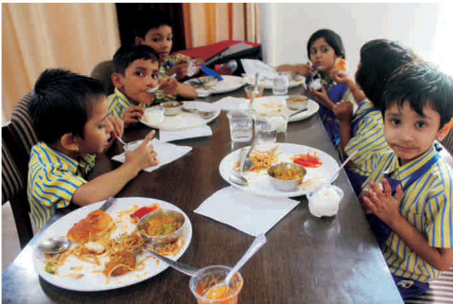
मुकुन्द विलास होटल में स्वादिष्ट लंच का आनन्द लेते बच्चे