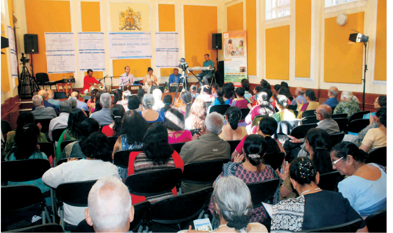
लंदन में कार्यक्रम का एक दृश्य

2 जून से 11 जून, 2017 तक तारा संस्थान व भारत वेलफेयर ट्रस्ट द्वारा भजन व भक्ति संगीत की एक शृंखला यू.के. विभिन्न शहरों जैसे : लेस्टर, ब्रेडफर्ड, बर्मिंघम व लन्दन आदि में आयोजित की। इस कार्यक्रम का मुख्य उद्देश्य आनन्द वृद्धाश्रम के नवीन परिसर के निर्माण हेतु दान सहयोग जुटाना था। इस कार्यक्रमों में यू.के. निवासी अनेक संस्थान के इस प्रकल्प विशेष को सहयोग की घोषणाएँ की। कार्यक्रमों की कुछ झलकियाँ :